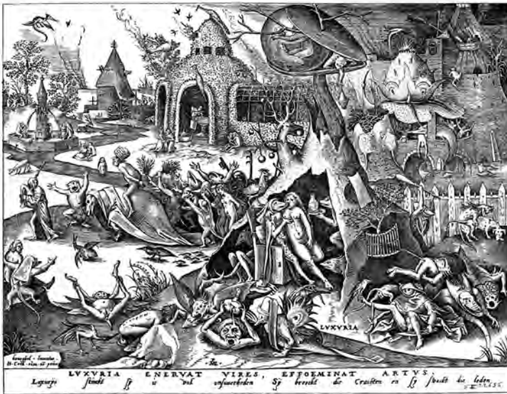
Pieter Brueghel d. Ä., Die sieben Todsünden, Luxuria (Unkeuschheit), 1558